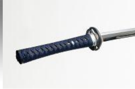
Minosaka Brand "Yagyū-Koshirae"